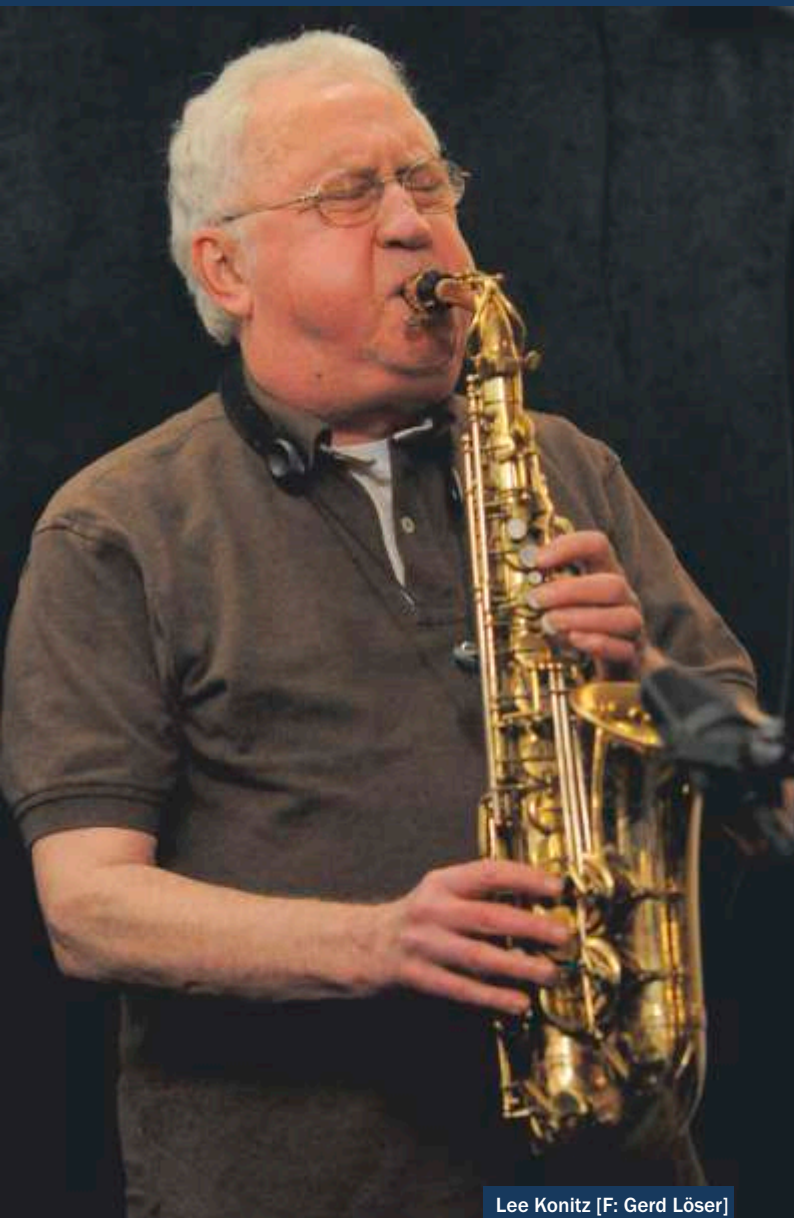
Lee Konitz