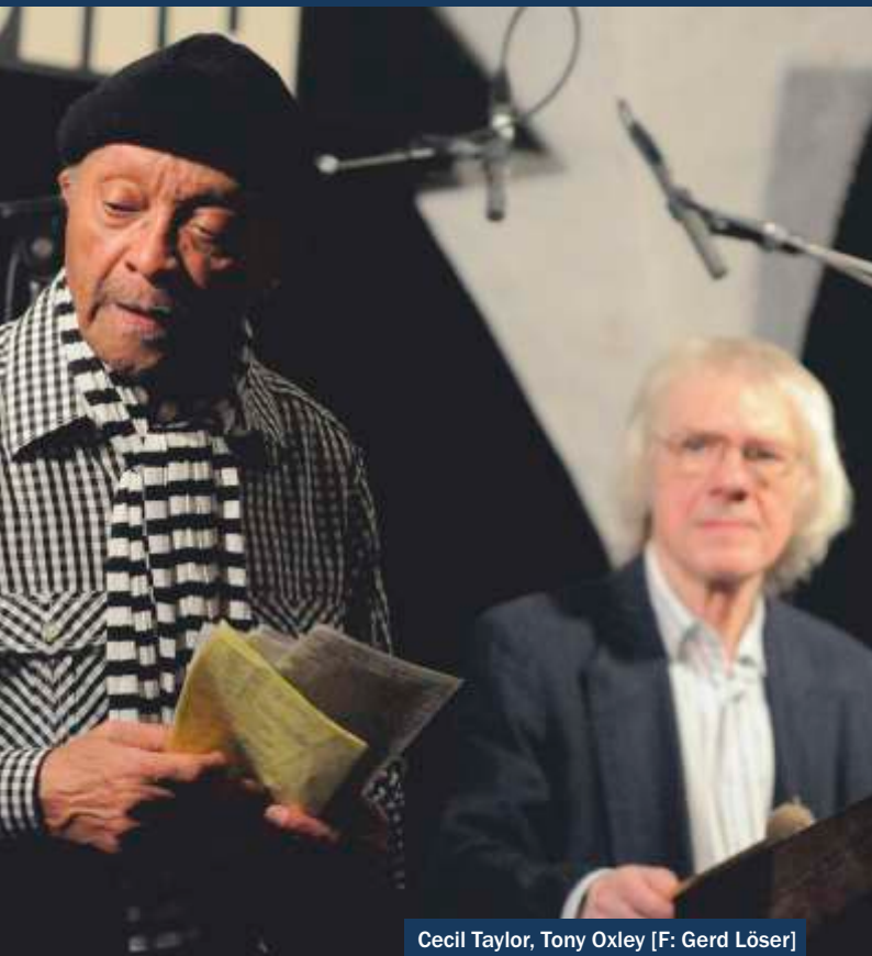
Cecil Taylor, Tony Oxley