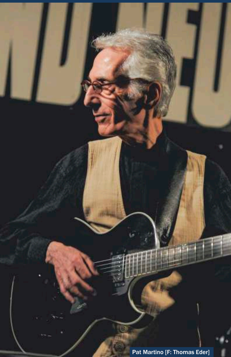
Pat Martino