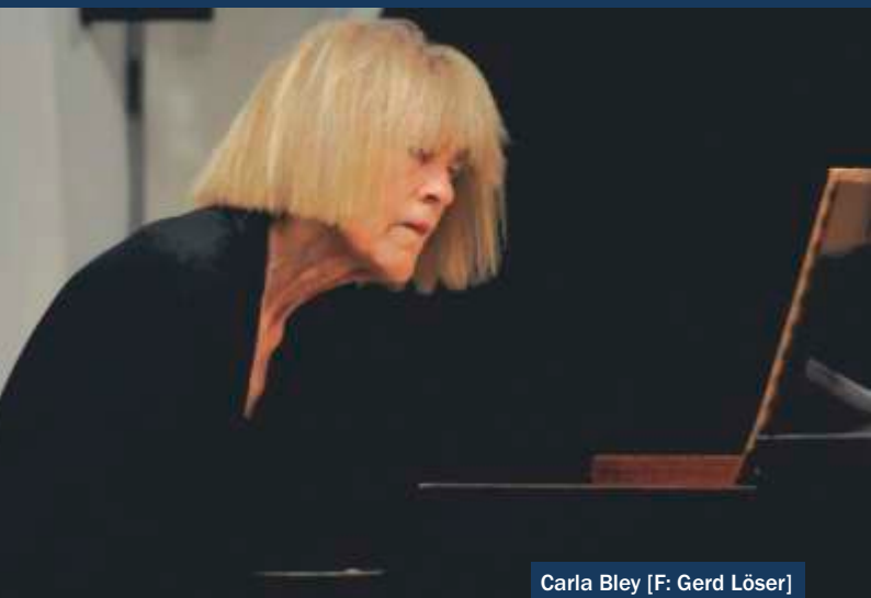
Carla Bley