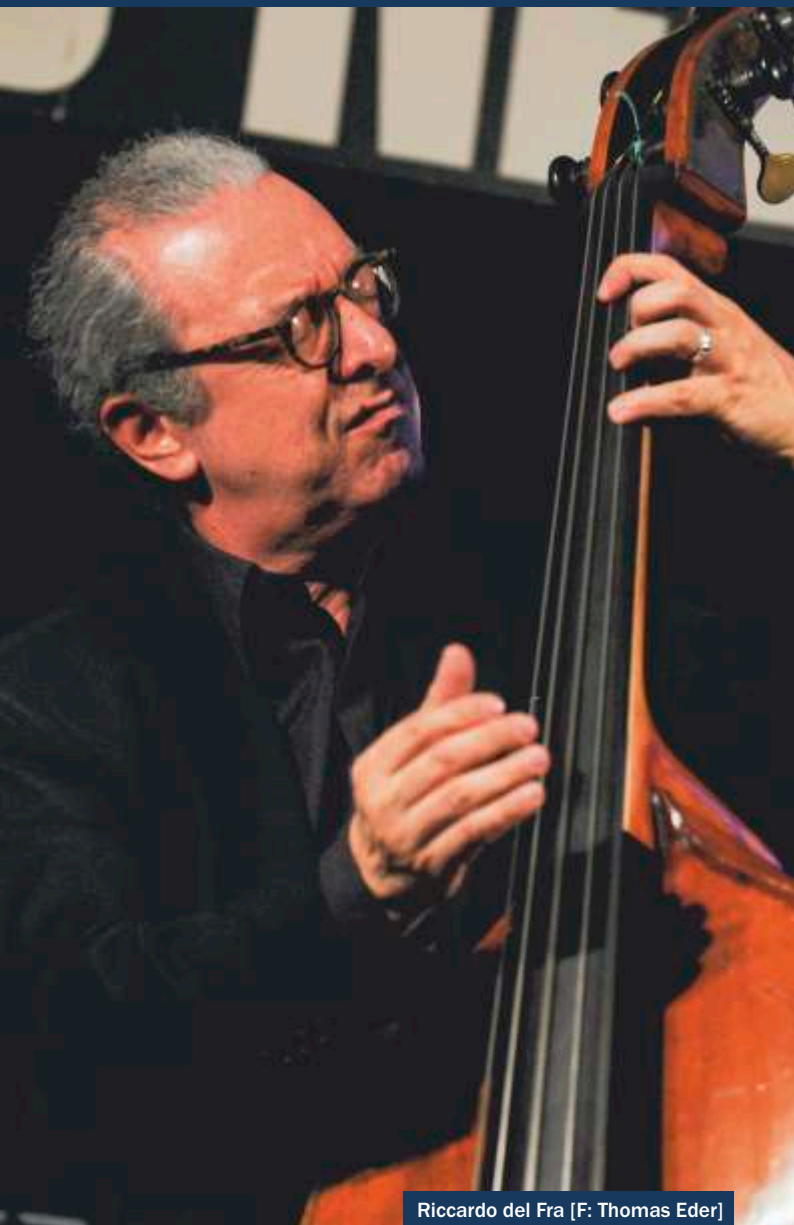
Riccardo del Fra [F: Thomas Eder]