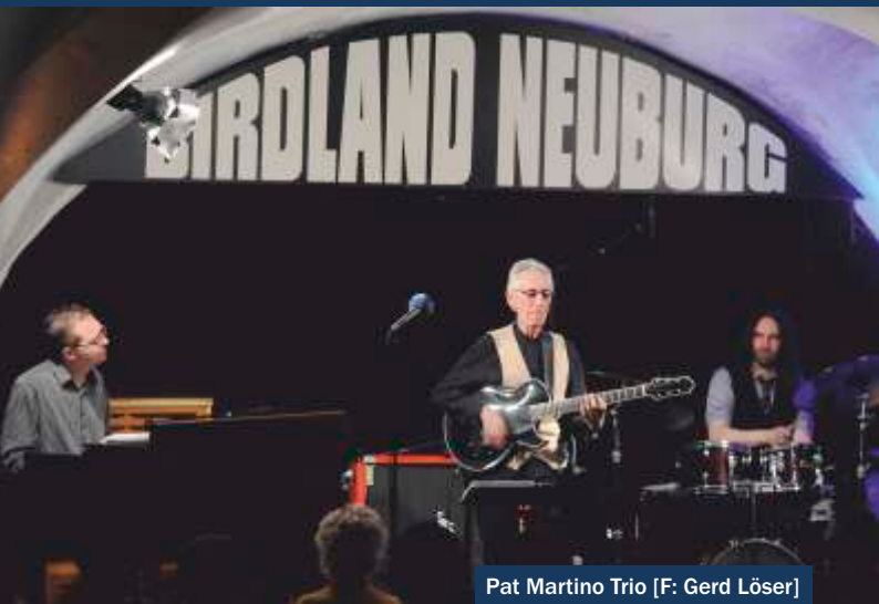
Pat Martino Trio