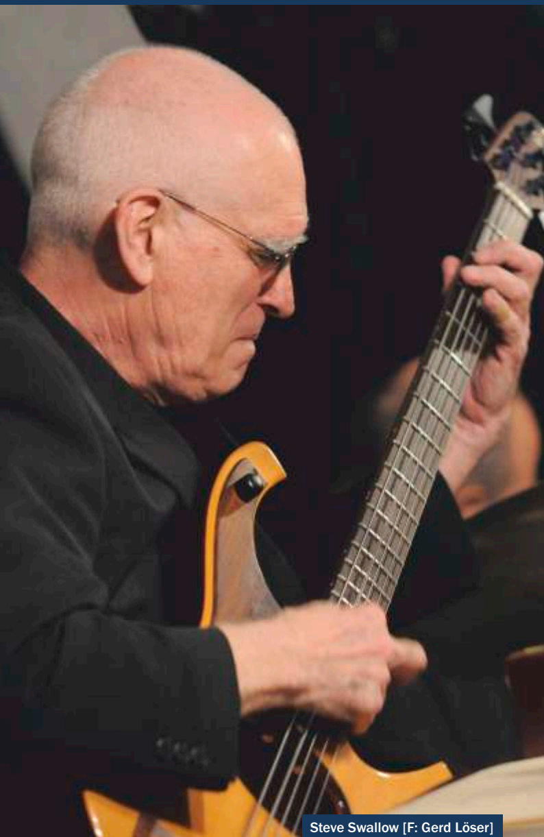
Steve Swallow